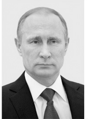
ՎԼԱԴԻՄԻՐ ՊՈՒՏԻՆ ՌԴ ԱՆՔԱԳԱՀ

հետ եւ քննարկել ԼՂ հարցով պայմանավորվածությունների իրականացման ընթացքը: