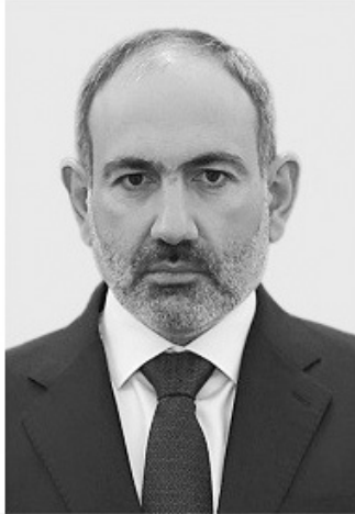
ՆԻԿՈԼ ՓԱՇԻՆՅԱՆ ՀՀ ՎԱՐՉԱՊԵՏ

Իր հերթին ՌԴ նախագահ Վլադիմիր Պուտինը երեկ հեռախոսազրույց է ունեցել ՀՀ վարչապետ Նիկոլ Փաշինյանի