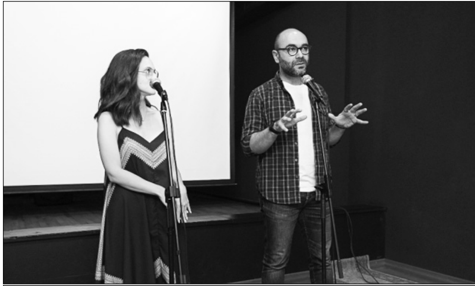
A FILM BY ESSAM NAGY

Էսսամ Նագին վավերագրական ֆիլմեր է թողարկել եւ նկարահանել շատ երկր-