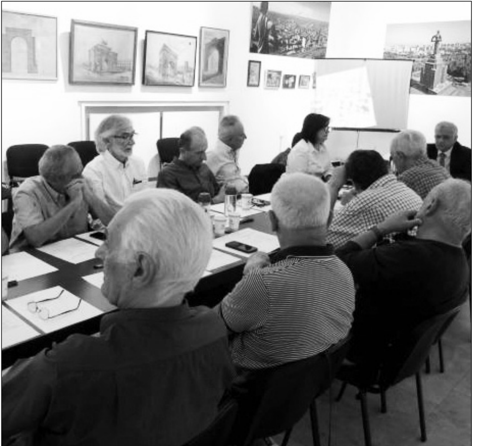
Առաջին նիստի ընթացքում, քաղաքաշինական խնդիրների համատեքստում, անդրադարձ է կատարվել մայրաքաղաքի կենտրոնական հատվածներում կառուցապատման կանոնակարգման հարցին:

Կոմիտեի ղեկավարը ներկայացրել է համագործակցության նման ձեւաչափի ստեղծման նպատակը եւ խորհրդի աշխատանքների կազմակերպման կարգը: Շնորհակալություն հայտնելով ներկաներին կարելուր նախաձեռնությանը մասնակից լինելու համար՝ նա ընդգծել է մասնագիտական հանրության անմիջական մասնակցությամբ ոլորտի հիմնախնդիրների լուծման առավել արդյունավետ տարբերակներ վերհանելու կարելությունը: