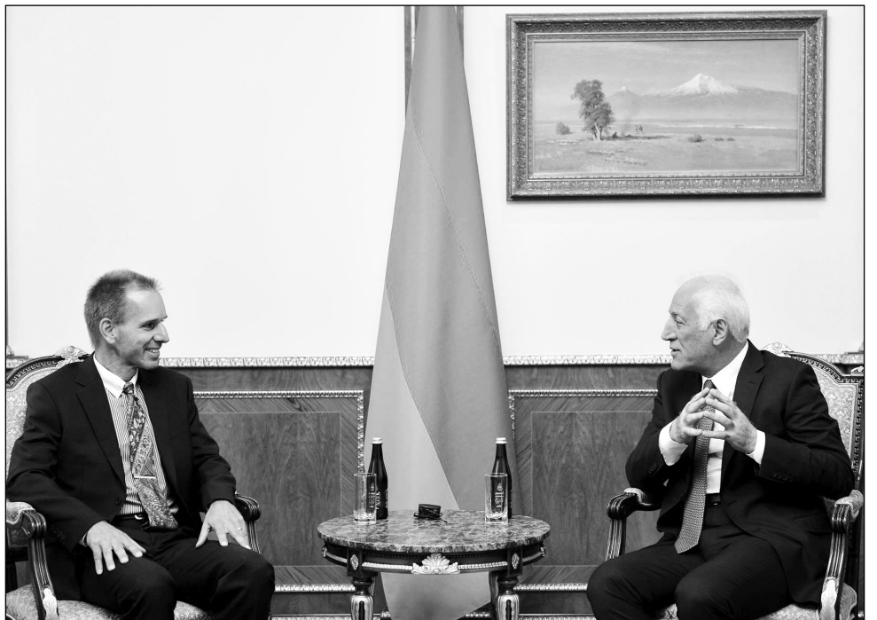
Նախատեսվում է նաեւ ՀՀ վարչապետի եւ ՌԴ նախագահի հանդիպումը:

Կառավարության ղեկավարը Վլադիվոստոկում կմասնակցի «Բազմաբեւեռ աշխարհի ճանապարհին» թեմայով Արեւելյան տնտեսական 7-րդ համաժողովի լիագումար նստաշրջանին, որը տեղի կունենա Ռուսաստանի նախագահ Վլադիմիր Պուտինի եւ այլ պետությունների ղեկավարների մասնակցությամբ. ասված է Հայաստանի վարչապետի աշխատակազմի լրատվականի հաղորդագրությունում: