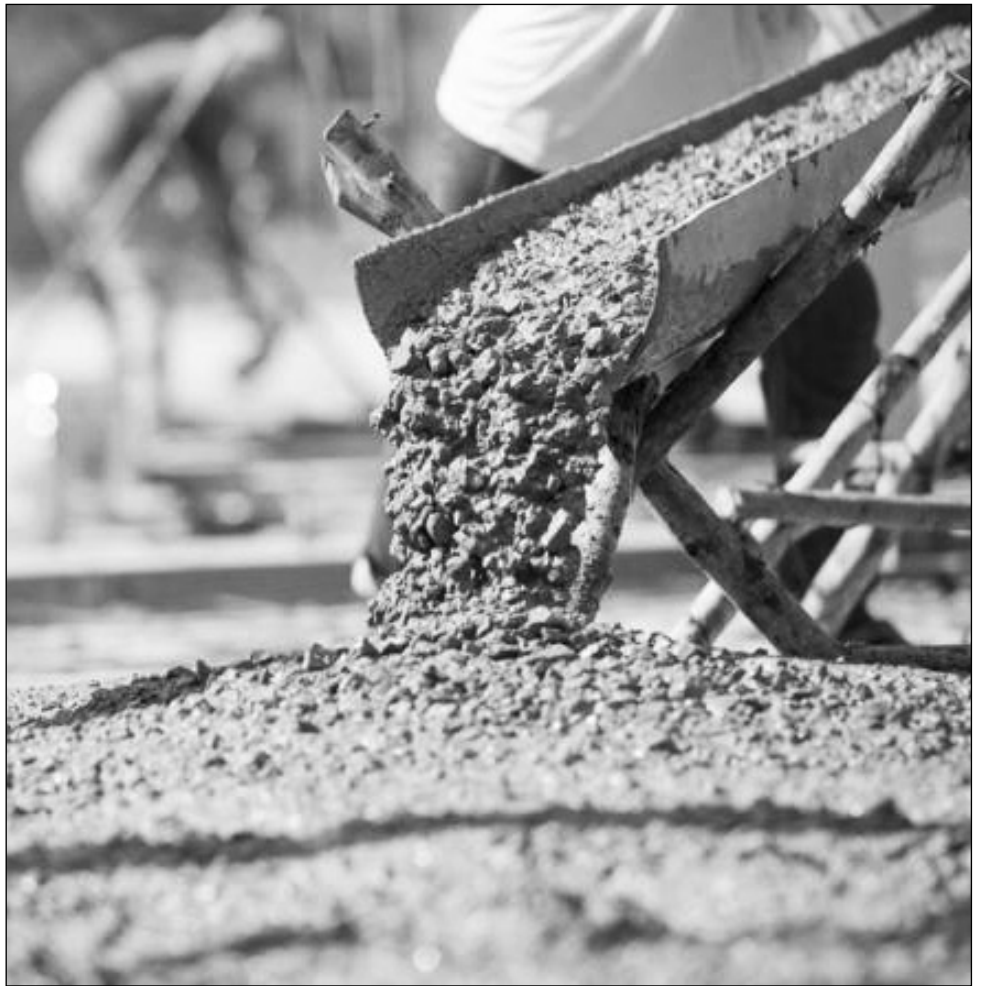
Կանխելով շուկայի հետագա կենտրոնացումը, գների չիմնավորված աճը:

Նախագծի ընդունման արդյունքում կճշգրտվի 2019թ. գործող կարգավորումը՝ համապատասխանեցնելով ցեմենտի շուկայում վերջին զարգացումներին եւ փոփոխված էլակետային պայմաններին: Կվերանականգնվի ցեմենտի շուկայի հավասարակշիռ մրցակցային վիճակը՝