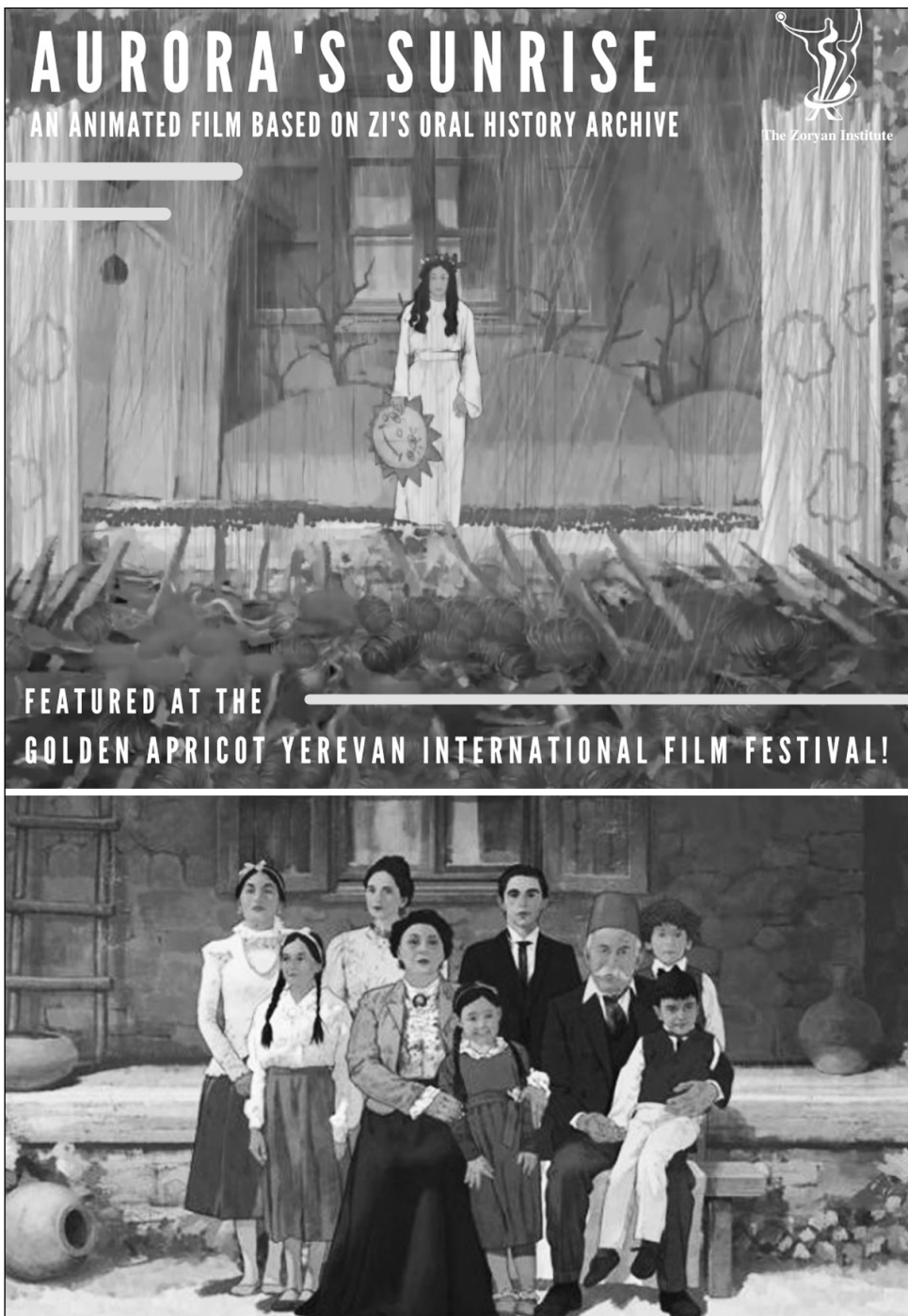
Նակավոր անիմացիոն ֆիլմերի փառատոնում, ցուցադրվել է Երեւանի «Ոսկե ծիրան» միջազգային կինոփառատոնի 2022-ի հուլիսի 10-17-ը և արժանացել է արծաթե ծիրանի:

Ֆիլմը, որի պրեմիերան կայացել է Ֆրանսիայում «Անսի» միջազգային հեղինակավոր անիմացիոն ֆիլմերի փառատոնում, ցուցադրվել է Երեւանի «Ոսկե ծիրան» միջազգային կինոփառատոնի 2022-ի հուլիսի 10-17-ը և արժանացել է արծաթե ծիրանի: