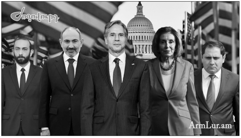
տահանման հարթակ»,- նշվում է հոդվածում:

Գործողությունների իմաստը հետեւյալն է՝ ցույց տալ Հայաստանի անվտանգային խոցելիությունը, որպեսզի վերջինս թույլ առաջ դիմի «Ռուսաստան-Բելառուս» միութենական պետության մաս դառնալու համար: Այս տրամաբանությունը զարգացնելու քայլերը Ադրբեյջանի ագրեսիվությունն է, ՀՀ-ում տեղակայված ռուսական զորքի իներտությունը, Ռուսաստանի քաղաքական իներտությունը եւ Հայաստանին գեղքի մատակարարման պարտավորությունները չկատարելը: Վերջին գործիքի կիրառումը պատահական չէ եւ օգտագործվել է նաև նախկինում, զորորինակ՝ 2016-ի պատերազմից առաջ եւ հետո: Հայաստանը պետք է հնարավորինս խոցելի լինի, որ հնարավորինս պինդ գրկի Ռուսաստանին... Ուկրաինայում գործերի ոչ այնքան հաջող ընթացքը ըստ էության ավելի է սրել 2011-ից հետո հաստատված այն վիճակը, որ Ռուսաստանը դժվարանում է հիմա արդեն 2020 թվականից հետո հաստատված ստատուս քվոյի երաշխավորը լինել: Խճաբերդն ու Փառուխը դրա վառ վկայությունն են: Թուրքիայի եւ Ադրբեյջանի դերը ավելի է մեծացել, եւ հիմա Ադրբեյջանը կարող է դառնալ ՌԴ-ից ԵՄ գազի եւ նավթի արտահանման հարթակ»,- նշվում է հոդվածում: