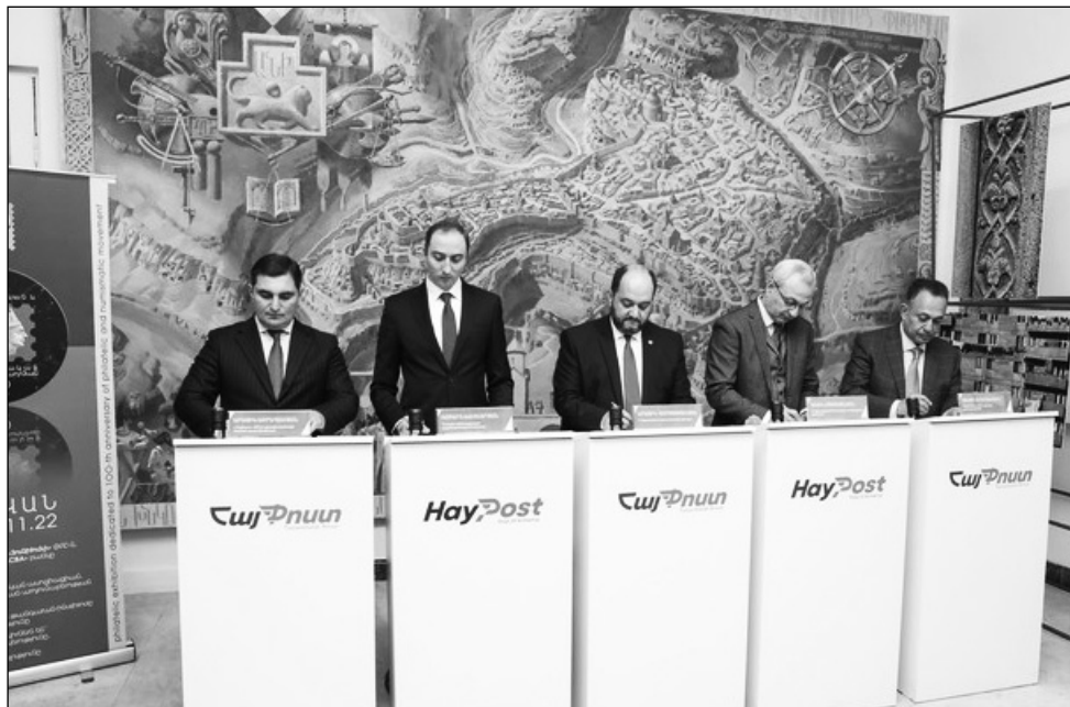
Ցուցահանդեսի շրջանակում շրջանառության մեջ է դրվել Նաեյ մեկ նամակահիշ՝ նվիրված «Ֆիլատելիստների եւ նումիզմատների միություն» կազմակերպության 100-ամյակ» թեմատիկին:

Ցուցահանդեսը կտեղի 4 օր եւ կավարտվի Նոյեմբերի 18-ին: