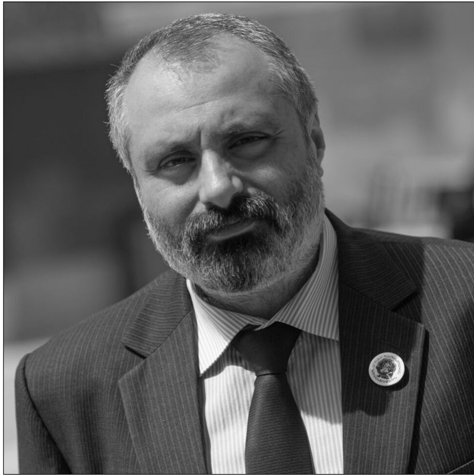
Գոտին չի պահպանվում: Այսինքն՝ ադրբեջանցիները խախտում են նաեւ այդ դրույթը:

-Իսկ ճի՞շտ է այն տեղեկատվությունը, որ վերջերս շահագործման հանձնված ճանապարհի երկայնքով անվտանգության համար նախատեսված 5 կմ բուֆերային