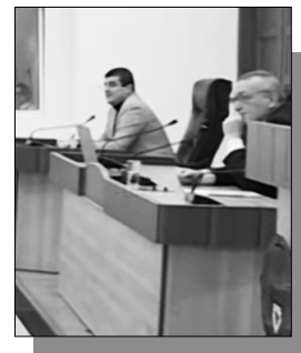
⇒ էջ 3

«Ժողովուրդ» օրաթերթին բացառիկ մանրամասներ են հայտնի դարձել Արցախի նախագահ Արայիկ Զարությունյանի եւ արցախցի պատգամավորների երեկվա հանդիպումից: Արցախից մեզ հայտնեցին, որ մոտ մեկ ժամ տեւած հանդիպման ժամանակ քննարկվել են մեծ մասամբ անվտանգային հարցեր: Արայիկ Զարությունյանը արցախցի պատգամավորներին հստակ ասել է, որ իրավիճակն Արցախում ծայրահեղ է, իսկ Լաչինի միջանցքի հարցն, առհասարակ, փակուղում է. Ադրբեյջանը իրաժարվում է բանակցությունների դուրս գալ որեւէ կողմի հետ: Ինչ վերաբերում է Արցախի պետնախարար Ռուբեն Վարդանյանի իրաժարականի հետ կապված խոսակցություններին, Արցախից մեզ մանրամասնեցին, որ թեեւ ոչ ուղիղ տեսչատով, բայց խոսվել է, որ իրաժարականի պահանջը գալիս է Հայաստանի իշխանություններից եւ Արեւմուտքից: Հայաստանի իշխանություններին, մասնավորապես, դուր չի եկել Ռուբեն Վարդանյանի քննադատությունն այն մասին, որ Հայաստանի իշխանությունը, ֆինանսական օգնությունից բացի, այլ քայլ չի անում Արցախում ստեղծված ճգնաժամի լուծման հետ կապված: Արցախի մեր աղբյուրները հայտնեցին, որ Արայիկ Զարությունյանն իր խոսքում վստահեցրել է, թե Ռուբեն Վարդանյանի հետ անձնական որեւէ խնդիր չունի: Արցախում բոլորը գիտեն, որ իրականում թեեւ տպավորություն կա, թե Ռուբեն Վարդանյանին Մոսկվայից են նշանակել պետնախարար, իրականում այդպես չէ, առավել եւս՝ որ ՌԴ շահի դեմ Վարդանյանն արդեն դուրս է եկել իր տարբեր հայտարարություններով, այսինքն՝ Վարդանյանը «ռուսների մարդը չէ», նրան Արայիկ Զարությունյանն է նշանակել՝ չճշտելով այդ նշանակումը ոչ ՀՀ-ի, ոչ էլ ՌԴ-ի հետ: