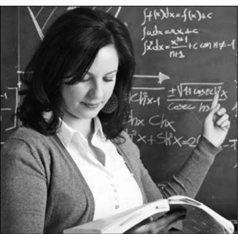
հաշվարկվում է աեստավորումից սկսված:

ՀՀ կրթության, գիտության, մշակույթի եւ սպորտի նախարարությունը հանրային ֆինանսավորման է ներկայացրել արտադրողական ուսումնական հաստատությունների մանկավարժական աշխատողների կամավոր աեստավորման եւ աեստավորման արդյունքում ՀՀ տեսական բյուջեից լրավորման համար կարգի նախագիծը: Ներդրված կամավոր աեստավորման համակարգի փորձնական ծրագիրը բարոնակաբար կյտնախուսի մանկավարժական աշխատողների մասնագիտական զարգացումը եւ լրավորման սրամարման միջոցով կնոպասի դասավանդման որակի եւ արդյունավետության բարձրացումը: Նախագիծով սահմանվել է.