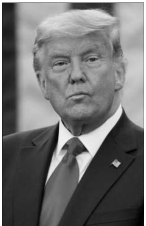
գրում են, որ Թրամփին սպառնում է երկու տասնյակից ավելի մեղադրանք՝ կապված

Առաջմ պարզ չէ, թե կոնկրետ ինչ մեղադրանք է առաջադրվել նախկին նախագահին, սակայն ամերիկյան ԶԼՄ-ները