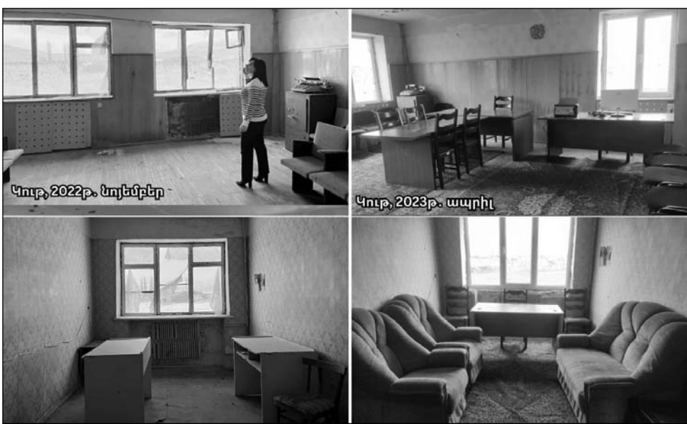
USAID Armenia-ի կողմից, գույքը ձեռք բերվեց Ազգային ժողովից, մնաց տանիքի հարցը լուծենք... Նորոգումը դեռ չէմ ասում: