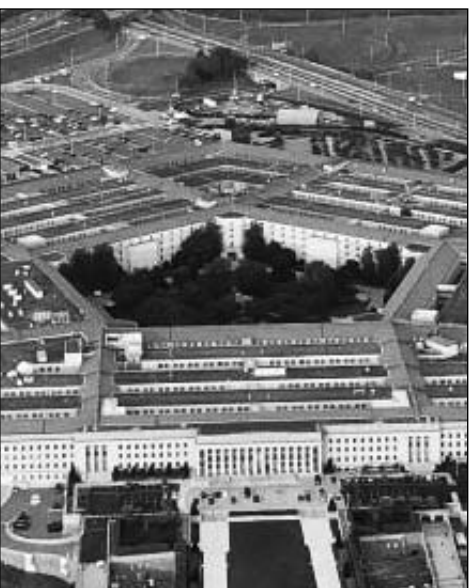
Թյուրինգ շարունակվում է, Պաշտպանության նախարարությունը միջոցներ է ձեռնարկել այդ փաստաթղթերը սահմանափակելու համար»,- մամուլի ասուլիսի ժամանակ ասել է Փան Պիերը:

Պենտագոնը սահմանափակել է համացանց արտահոսած գեոստրատեգիայի փաստաթղթերի եւ գաղտնի տեղեկատվության հասանելիությունը առաջադրելով Միացյալ Նահանգների ազգային անվտանգությունը եւ նրա դաժնակիցների դաժնացող համար. ասել է Մոյսակ Տան մամուլի ֆաբրիկայի Կարին Փան Պիերը: