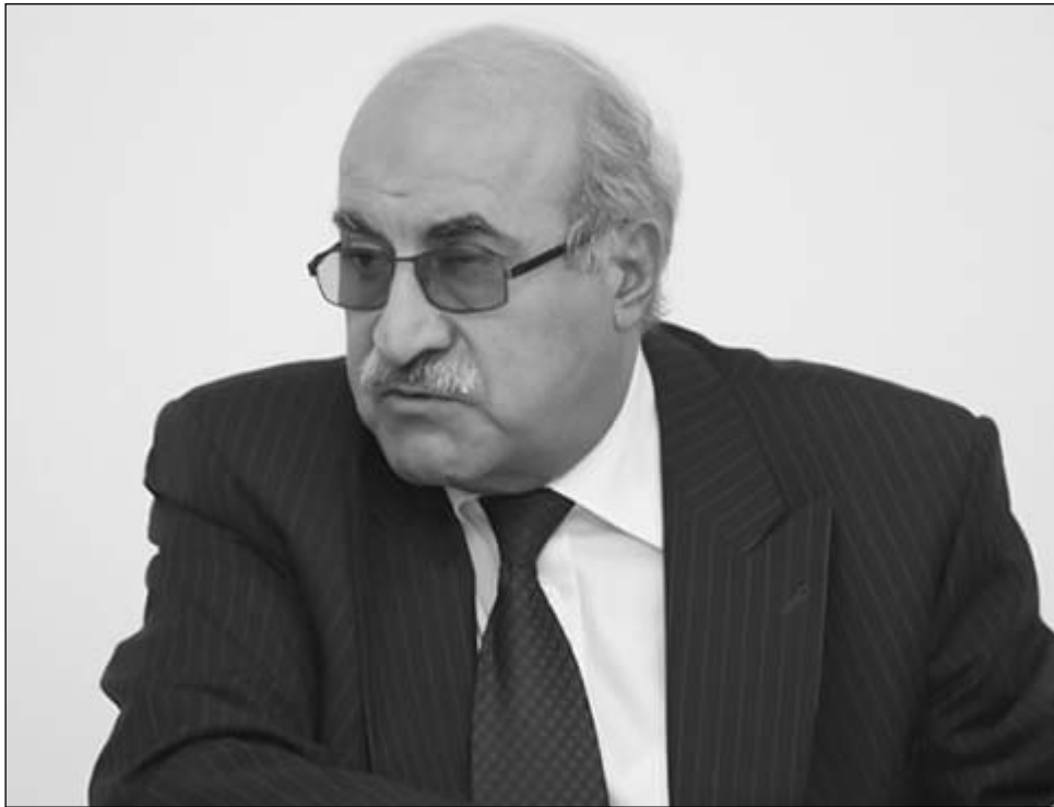
Լուրջ հարցին, իրավապահները, կարծես, ընդհանրապես չեն էլ շտապում:

-Պարոն Հարությունյան, կարող ենք նաեւ արձանագրել, որ, օրինակ, երբ որեւէ քաղաքացի հայիցում է վարչապետին կամ իշխանության ներկայացուցիչներից որեւէ մեկին, իրավապահներին հաջողվում է ժամերի ընթացքում գտնել այդ քաղաքացուն եւ պատասխանատվության ենթարկել, իսկ այս դեպքում, երբ հարցը վերաբերում է անվտանգային