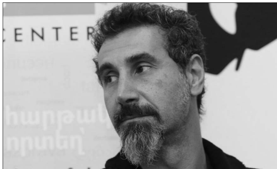
«...գրել է Թանկյանը: Ադրբեջանը շարունակում է կիրառել հայերի հանդեպ իր օրինական շրջափակումը՝ տեղադրելով անցակետ»:

Ամերիկահայ երաժիշտ, SOAD-ի հայցնի անդամ Մերժ Թանկյանն ինսագրամայան իր էջում հիշեցրել է Հայոց ցեղասպանության զոհերի հիշատակի օրվա մասին: Նա կիսվել է գրառմամբ, որտեղ ասվում է. «Փիսակցումն ու ազգային ցավը մնում է մեր հավաքական հիշողության մեջ: Այն բարոնակ մեզ հիշեցնում է ամուր կադրված միասնականության մասին, որը մենք ողբում է կիրառելով, որդեսգի հասնելով ազգային բարգավաճման»: