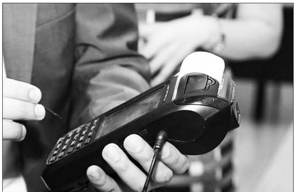
Այս օրինագծով նախատեսվում է 5