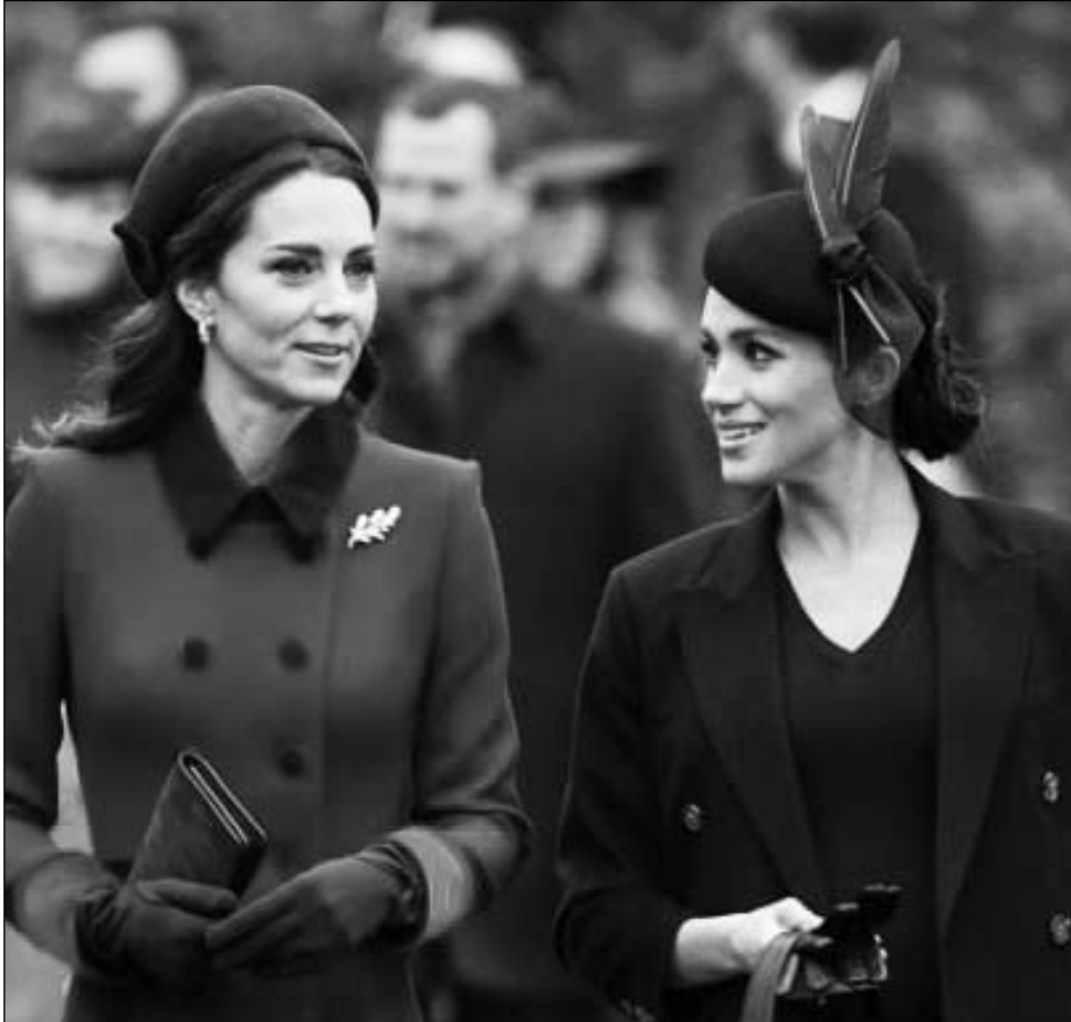
Այնուամենայնիվ, եղել են այնպիսիք, որոնք պաշտպանել են Չարրիի սիրելիին: «Մեգանը պլաստիկ վիրահատության չի դիմել: Ամեն ինչ լուսավորության եռակուսի մեջ է: Իսկ մագերի ուղղում այն է, ինչ անում են շատ աֆրոամերիկացի կանայք: Սա ոչ մի կապ չունի «ծագման հետքերը ջնջելու հետ», - նշել է մեկնաբաններից մեկը:

Մեգան Մարքլը երկար ժամանակ անց առաջին անգամ հայտնվել է հանրության աչքի առջև: Հանգստյան օրերին TED Talk-ում ցուցադրվել է Մասեֆսի դիտարկում մասնակցությամբ ռեալիթի: Նա ներկայացրել է իր մտերիմ ընկեր Միսսան Հարիմանին, որը դասախոսություն էր կարդում: Այնուամենայնիվ, ամբողջ ուժադրությունը սեռավոր է նրա վրա, քանի որ ներկայացել է նոր իմիջով: