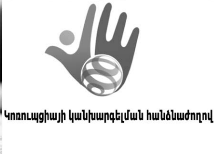
Կոռուպցիայի կանխարգելման հանձնաժողով