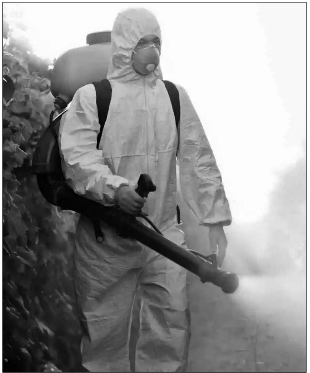
խնդրում եմ, այս հարցերը դուք էլ բարձրացրեք, ժողովուրդ ջան, շատ-շատ վտանգավոր թեմա է, ախր:

Այս հարցը բարձրացրել եմ բազմաթիվ պաշտոնյաների, տեղյակ եմ պահել, խոսել եմ հնարավոր ռիսկերի մասին, եւ այսքան ամիսների ընթացքում տեղի է ունեցել մի թեթեւ տեղաշարժ: Ծիծառ ասած, վախենում եմ մինչեւ ԱԺ-ի արձակուրդը գնալը այս հարցը չլուծեն: Հարգելի՛ լրատվականներ ու բնապահպանական կազմակերպություններ,