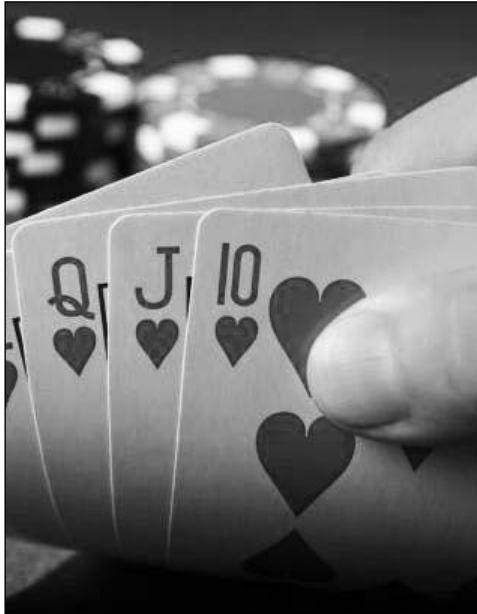
այդ թվում նաեւ «Պոկեր» տեսակի կենդանի խաղի անցկացման համար անհրաժեշտ խաղասեղաններ: