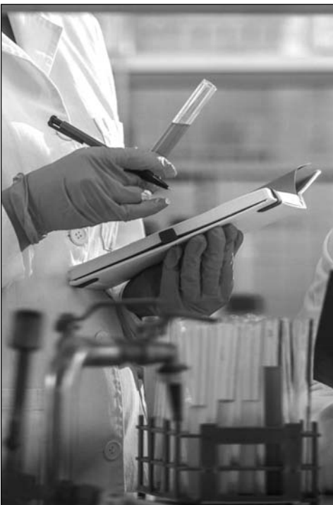
պարզ մեթոդների մշակման հնարավորությունը»,- ասել է նա:

ՀՀ ԳԱԱ «Հայկենսասեխնորգիա» գիտահետազոտական կենտրոնում ուսումնասիրվել են Հայաստանում եւ Արցախում սարածված խինդրոզի եւ Արենի սորերի խաղողի կորիզներից լուծամզման մեթոդով ստացված բնական յուղերի օրգանոլեոնիկ, ֆիզիկաքիմիական հատկությունները եւ ֆինալային բաղադրությունը: Որոշվել են նոյա-կային արտադրանքի օդաչափային ելքերը, սեղեկացնում է ՀՀ ԳԱԱ գիտության հանրայնացման եւ հասարակայնության հետ կապերի բաժինը: