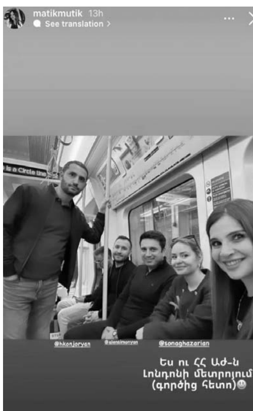
matikmutik 13h See translation

Այսպիսով, հունիսի 6-9-ը ԱԺ պատվիրակությունը աշխատանքային այցով մեկնել էր Լոնդոն: Պատվիրակության կազմում էին ԱԺ նախագահ Ալեն Սիմոնյանը, ԱԺ փոխնախագահ Ռուբեն Ռուբինյանը, «Քաղաքացիական պայմանագիր» խմբակցության ղեկավար Հայկ Կոնջոր-