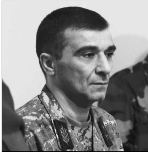
Առաջինը Շուշի մտած անձանցից էմ հանդիսանում:

Պաշտպանության բանակի նախկին հրամանատար, գեներալ-լեյտենանտ Միհայել Արզումանյանը «Ժողովուրդ» օրաթերթի միջոցով հայտարարություն է արձակել: Այն ներկայացնում է մի անհատ. «Վերջին երջանում հաճախակիացել են արբեր դաշտում անհատական կողմից իմ վերաբերյալ իրականությանը չհամապատասխանող տեղեկությունների հրատարակումը, ուստի կարճ ցանկանում եմ անդրադառնալ դրանց: