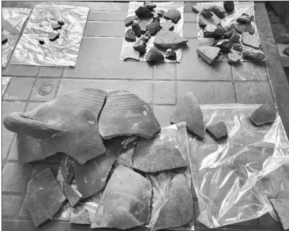
Նացնելու համար (ղեկավարներ՝ Արթուր Պետրոսյան եւ Ռոբերտ Ռան):

ՀՀ ԳԱՄ հնագիտության եւ ազգագրության ինստիտուտի հնագիտական արձակուրդը սկսել է ռեզումենտը ՀՀ Կոսայի մարզի Հասիս լեռան վրա նոր հայտնաբերված ամրոցի արածում: