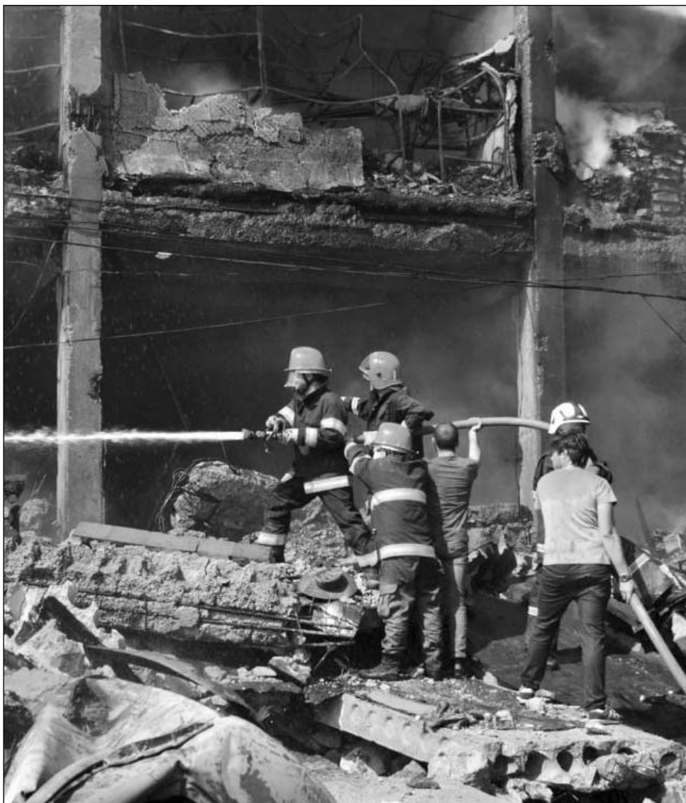
Լից, սակայն, ինչպես ինքն է պնդում, ապարդյուն:

2021թ. ապրիլի 6-ին Երեւանի «Սուրմալու» առևտրի կենտրոնում տեղի ունեցած հրդեհի հետեւանքով հարուցված քրեական գործը միացվել է 2022թ. օգոստոսի 14-ին նույն հասցեում տեղի ունեցած պայթյունի հետեւանքով նախաձեռնված քրեական վարույթին: Գլխավոր դատախազությունից հայտնում են, որ 2021թ. հրդեհի հետեւանքով «Երեւանի պահածոների գործարան» ՓԲԸ-ին պատճառվել է 46 մլն 279 հազ., իսկ 16 տաղավարների այրման հետեւանքով պատճառված վնասի չափը կազմել է մոտ 15 մլն դրամ: Բացի այդ, 5 ՍՊԸ-ի եւ 6 անհատ ձեռնարկատիրոջ պատճառվել է խոշոր գույքային վնաս՝ ընդհանուր 505 մլն 421 հազ. դրամի չափով: