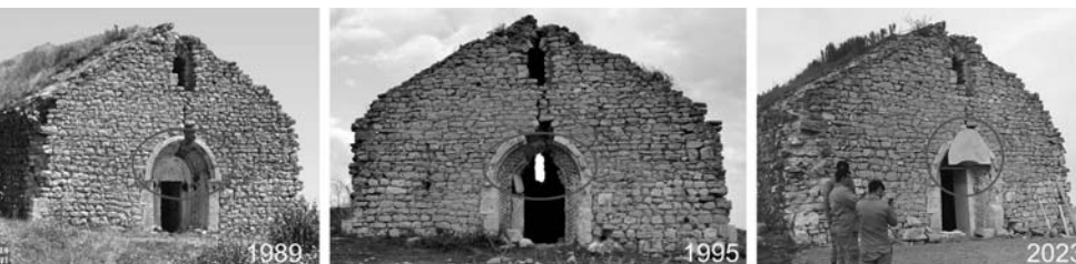
Նա լուսանկարներ հրատարակելով վանքի:

«Հ. Լուսանկարներում վանքի շքամուտքի արձանագրությունը մինչև ոչնչացումը, ոչնչացումից հետո և սկզբում անճանկ մի այլ ֆախի սկզբնական հենք»,- գրել է