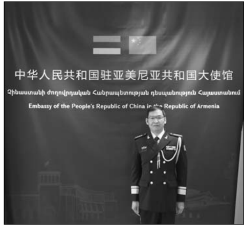
Չինաստանի Ժողովրդական Հանրապետության դեսպանության Հայաստանում Էմբասի of the People's Republic of China in the Republic of Armenia

Չինաստանը միշտ եղել է համաշխարհային խաղաղության կերտողը, իր ներդրումն է ունեցել համաշխարհային գլոբալ զարգացման գործում, եղել է միջազգային կարգի պահպանող, իսկ չինական բանակը՝ համաշխարհային խաղաղության պահպանման հուսալի ուժ։