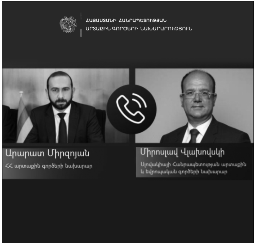
Արարատ Միրզոյան ՀՀ արտաքին գործերի նախարար

ՀՀ փոխվարչապետ Միքայիլ Գրիգորյանի գլխավորած պատվիրակությունը կենկի Մոսկվա: ՀՀ կառավարության լրատվական ծառայությունից «Ժողովուրդ» օրաթերթին հայտնում են, որ պատվիրակությունը օգոստոսի 28-30-ը կմասնակցի Եվրասիական տնտեսական հանձնաժողովի խորհրդի նիստին: