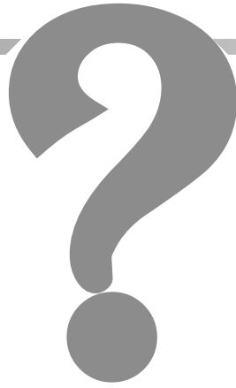
Էջը՝ ԱՆՎԱՐԴ ԿՈՇԿԱԿԱՐՅԱՆԻ