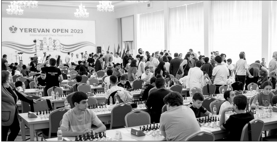
9 տուր շարունակ մասնակիցները կայաքարեն 15 մլն դրամ մրցանակային ֆոնդի համար: