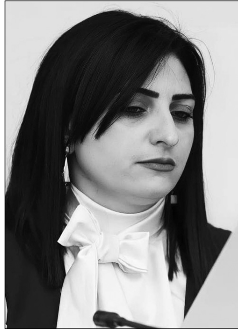
թյունն ու սեփականության իրավունքները պետք է պաշտպանվեն:

Եվրամիությունը կոչ է անում Ադրբեջանին ապահովել արցախահայերի իրավունքներն ու անվտանգությունը, այդ թվում՝ տեղահանվածների համար իրենց տներ վերադառնալու իրավունքը: Ղարաբաղի հայերի մշակութային ժառանգու-