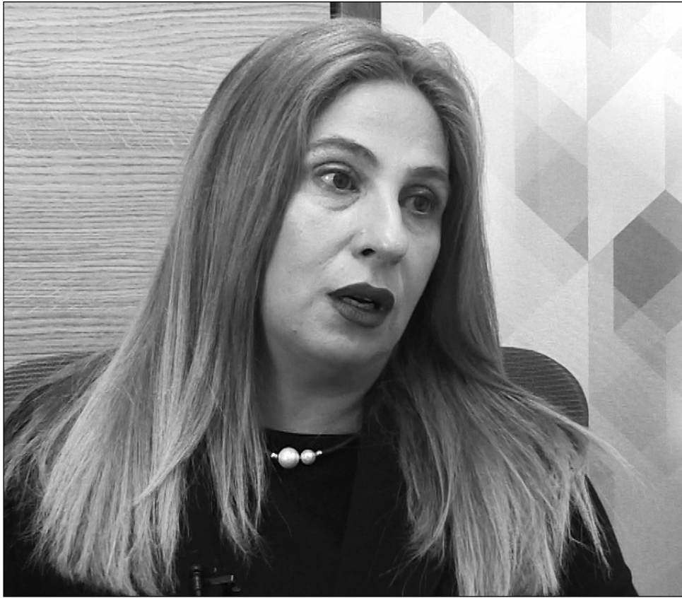
ընտրության հարցով, փոխքաղաքապետի ընտրության հարցով բոլորտել ենք:

-Դեռ չեմ որոշել, հիմա ինձ համար ավելի կարեւոր խնդիրներ կան: Մենք մինչ այս ավագանու նիստերը՝ քաղաքացիների