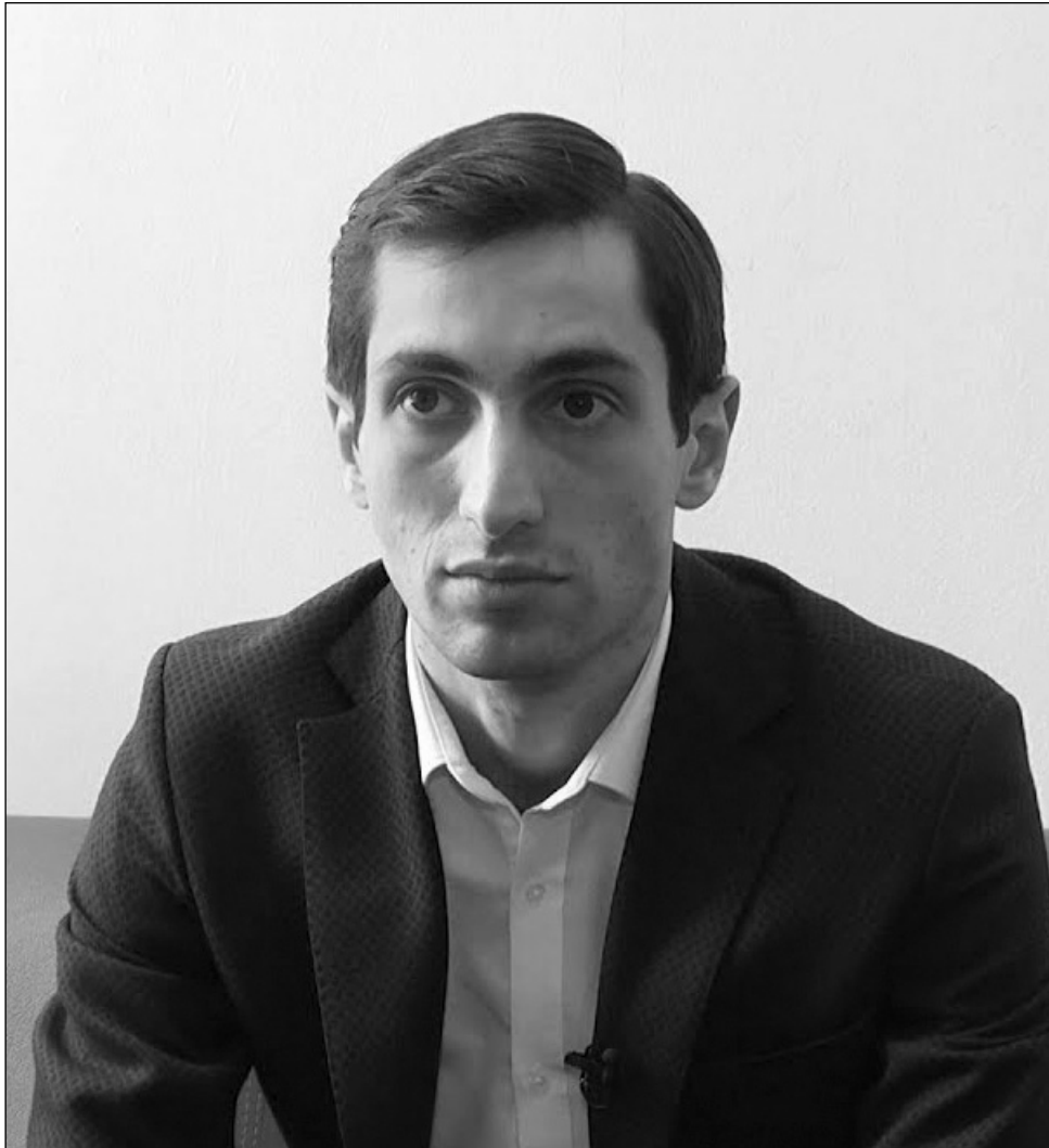
Կայն Ադրբեջանը այդպես էլ չի ենթարկվել պահանջներին:

-Իսկ բանակցություններում մեզ այդ դեկլարացիան ի՞նչ արդյունք է տալու, քանի որ գիտենք, պարոն Խաժակյան, որ մինչ այս էլ բազմաթիվ փաստաթղթեր են ընդունվել, բանաձեւեր են ընդունվել, սա-