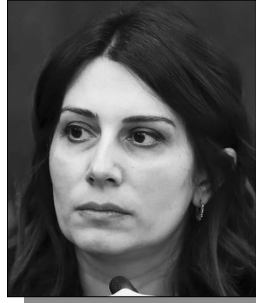
Շարունակությունը՝ ArmLur.am կայքում:

ՀՀ առողջապահության նախարար Անահիտ Ավանեսյանը 2024թ. պետությունից նախագծի մասին ելույթում հայտարարել է, թե երկրի բյուջեն թվերից ու տոկոսներից անդին նախատեսված մարդու մասին է, թե ինչպես կիրառորձի նրա ծնվելու, առողջ մեծանալու, կրթվելու, արարելու, երջանիկ ապրելու իրավունքը, եւ ինչ արդյունք կստեղծի նա իր կյանքով: Այնուհետեւ նա ավելացրել է. «Մի բան հստակ է՝ 2018թ. թավշյա, ոչ բռնի հեղափոխությունից հետո ամեն հաջորդ տարվա բյուջեն ցույց է տալիս, որ այս իրավունքների իրացումն է դառնում անկյունաքարային»: Այնուհետեւ տիկին նախարարը երկար թվերի շարք է ներկայացրել: Սակայն ուշադրություն դարձրեք Ավանեսյանի ձեռակերպումներին, թե բյուջեն մարդու մասին է, երջանիկ ապրելու իրավունքը ապահովելու մասին, եւ որ, իբր, 2018թ. հեղափոխությունից հետո այդ իրավունքի իրացումն անկյունաքարային է: Մենք այս հայտարարություններին ուշադրություն չէինք դարձնի, եթե չլիներ մի կարեւոր հանգամանք. 2018թ. «Երջանիկ անհատ, հոգատար հանրություն» եւ հզոր պետություն» կարգախոսով իշխանության եկած ուժը կարճ ժամանակ անց երկիրը հասցրեց աղետալի պատերազմի շեմին, ինչի հետեւանքով ունեցանք 4-5 հազար զոհ: Երջանիկ անհատ խոստացող ուժի քաղաքականության հետեւանքով հազարավոր ընտանիքներ պարզապես դժբախտացան: Հզոր պետության մասին խոսելն անիմաստ է, որովհետեւ Անահիտ Ավանեսյանի ղեկավարը՝ Նիկոլ Փաշինյանն ինքը, մի առիթով խոստովանել էր, որ երկրի անվտանգության ոլորտում իրենք ծախողել են, անգամ ասել էր, որ Հայաստանն իր անվտանգությունը չի կարող ապահովել, ուր մնաց Արցախի: