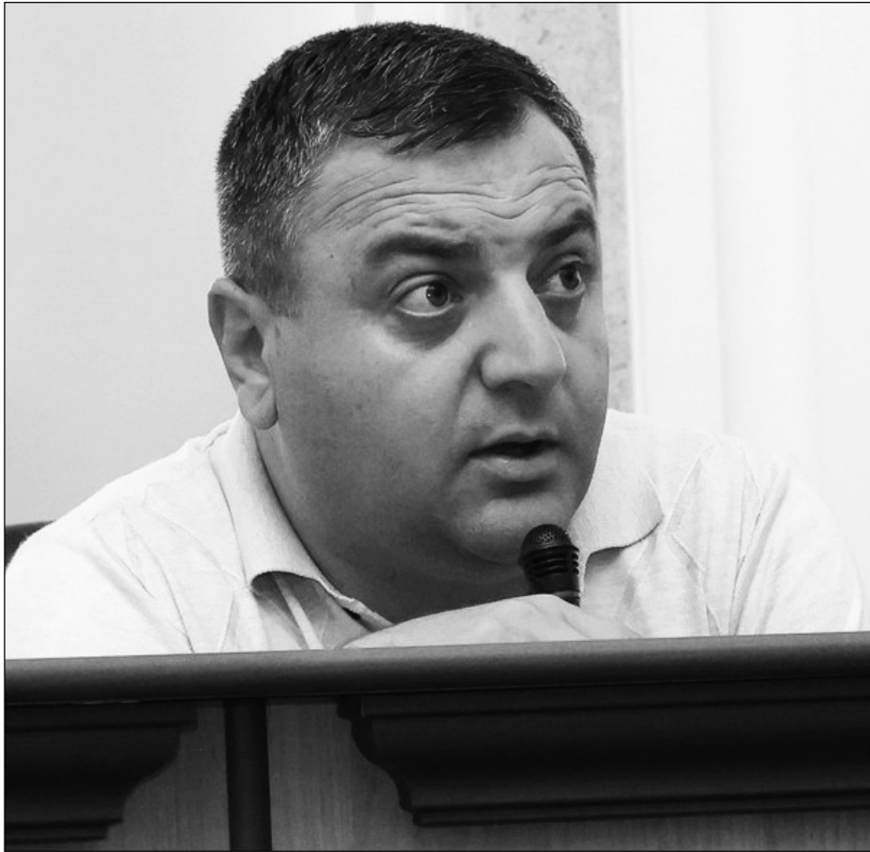
Իսկ կամ պատգամավորներ, որոնք չեն գալիս նիստերին:

«Ոչ թե օրակարգում, այլ դա պարտականություն է: Դա միշտ էլ եղել է Ազգային ժողովի պարտականություն և ոչ թե ցանկություն: Այն պատգամավորը, որը որ չի մասնակցում կամ, նախանշված օրենքի համաձայն, մի քանի նիստերից բացակայում է, խնդիրներ է ունենալու մանդատը պահելու հարցում:»