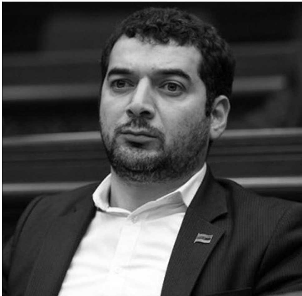
արտաքին ընտրությունների եւ ՔՊ արտաքին ծրագրերը զուգահեռաբար չեն: Ի՞նչ ընդհանրություն կա:

-Քաղաքական դաշտը պնդում է, որ Ադրբեյջանում փետրվարին կայանալիք