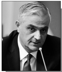
⇒ էջ 2

Հ Հ կառավարությունում նոր սեռի կարգինալ է հայտնվել, որն արդեն հասցրել է խանդի տեսարանների առիթ դառնալ: Խոսքը ՀՀ փոխվարչապետ Միհր Գրիգորյանի մասին է: «Ժողովուրդ» օրաթերթին կառավարական կաբինետից դժգոհություններ են փոխանցվել առ այն, որ փոխվարչապետը Նիկոլ Փաշինյանին զեկուցում է հարցերն ու երեույթներն այնպես, ինչպես իրեն է հարմար, որպեսզի իր մտերիմները մաքսիմալ օգուտ քաղեն պատեհ իրավիճակից: Հայաստանի գրեթե բոլոր խոշոր բիզնեսների հետ Գրիգորյանն այս կամ այն կերպ առնչվում է վերահսկողական տեսանկյունից՝ շինարարական մեծ ծրագրեր, «Վիվասել» ընկերության առեղծվածային վաճառքը նոր արդեն աղմկահարույց սեփականատերերին, «Հայփոստի» շենքի վաճառքը, «Ռենշին» խոշոր կառուցապատող ընկերությունը, HSBC-ի վաճառքն ու միավորումը «Արդշինինվեստբանկ»-ին, որտեղ ինքը տարիներ շարունակ տնօրեն է եղել: Կարճ ասած, մեծ ծրագրերը, որտեղ կան մեծ ֆինանսական հարցեր և շահույթ, Միհր Գրիգորյանի վերահսկողության տակ են: Երիտպաշտոնյաները սկսել են խանդի տեսարաններ նրա շուրջ: