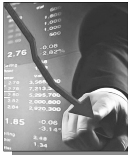
Շարունակությունը՝ ArmLur.am կայքում:

33 վիճակագրական կուրսերն ամփոփել է 2023 թվականի հունվար-հոկտեմբեր ամիսների հիմնական ժողովրդագրական ցուցանիշները. ստորեւ ներկայացնում ենք բնակչության բնական շարժի տվյալները: Զրապարակված նախնական տվյալների համաձայն՝ 2023 թվականի ընթացքում մահացածների ընդհանուր թվաքանակը կազմել է 20 հազար 152 մարդ: 2022 թվականի համեմատ՝ այս ցուցանիշը նվազ է 316-ով: Ցուցանիշում մահվան հիմնական պատճառները եղել են արյան շրջանառության համակարգի հիվանդությունները, նորագոյացությունները, շնչառական օրգանների հիվանդությունները եւ այլ հիվանդություններ: 33 բնակչության ծնվածների քանակը հունվար-հոկտեմբեր ամիսներին կազմել է 30 հազար 186 մարդ: Այս տվյալը ներառում է նաեւ մեռելածինների ցուցանիշները: Նախորդ տարվա համեմատ՝ այս ցուցանիշը աճել է 258-ով, եւ 2021 թվականի համեմատ՝ նվազել 134-ով: 33 պետական սահմանի եւ օդային, եւ՝ ցամաքային անցման կետերով 2023 թվականի հունվար-հոկտեմբեր ամիսներին, նախնական տվյալների համաձայն, Զայաստան է եկել 4 մլն 70 հազար 389 մարդ, որից 1 մլն 646 հազար 333-ը 33 փաստաթղթերով են հատել սահմանը: