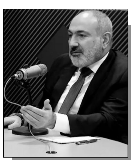
Շարունակությունը՝ ArmLur.am կայքում: