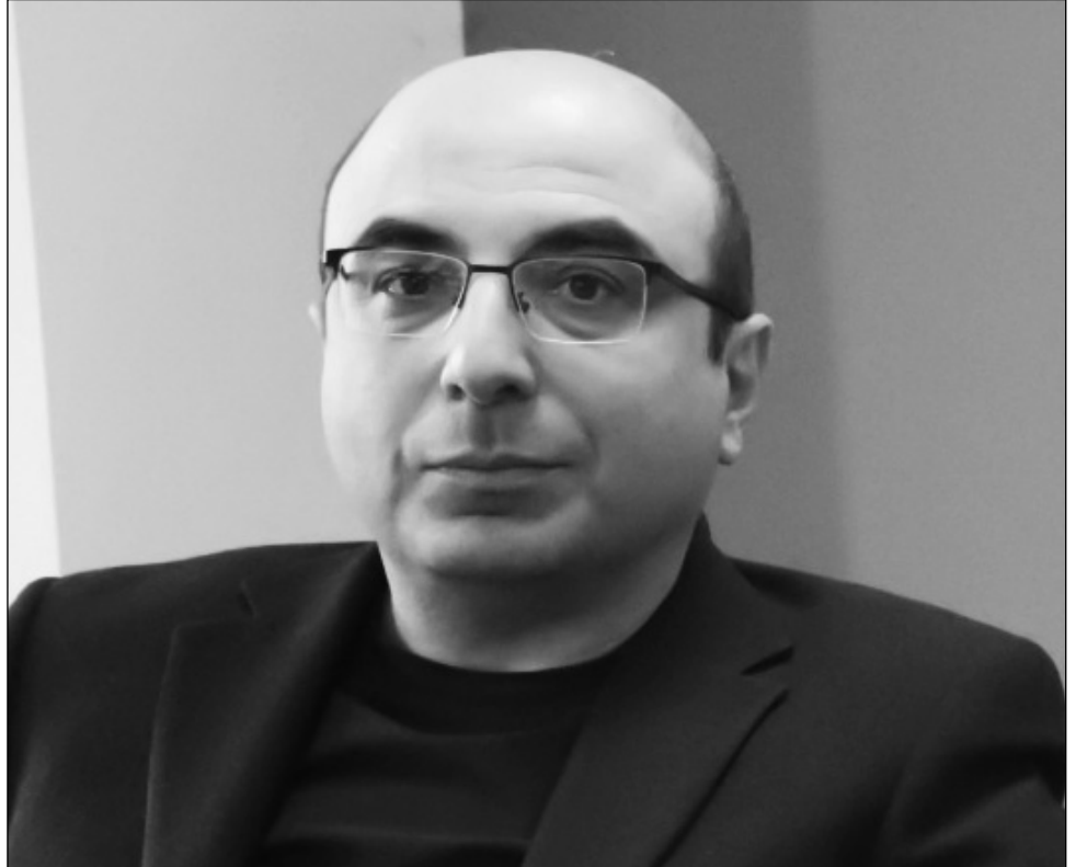
«Պոլիչկա դևել» հայրենասերի սյունակում

Ակցիայի մասնակիցներն իրենց ձեռքին ունեն Ադրբեջանի զինված ուժերի կողմից օկուպացված Արցախի Հանրապետության նախկին նախագահների՝ Արկարի Դուկասյանի, Բակո Սահակյանի, Արայիկ Հարությունյանի, Աժ Նախագահ Դավիթ Իշխանյանի ու Ադրբեջանում անազատության մեջ պահվող այլ անձանց լու-