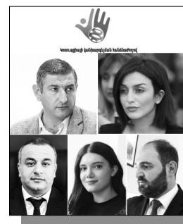
Շարունակությունը՝ ArmLur.am կայքում:

Կոռուպցիայի կանխարգելման հանձնաժողովը մտադիր է վարույթ հարուցել ավագանու 5 անդամների նկատմամբ, որոնք անհամատեղելիության կարգով նաեւ հանրային ծառայողի պաշտոն են զբաղեցնում: «Ժողովուրդ» օրաթերթը գրել էր, որ Երեանի ավագանու «Քաղաքացիական պայմանագիր» խմբակցության ավագանու մի շարք անդամներ ավագանու անդամի պաշտոնի հետ անհամատեղելի պաշտոններ են զբաղեցնում: Այսպես, ավագանու իշխանական անդամ Վլադիմիր Կիրակոսյանը համատեղությամբ նաեւ Անտառային կոմիտեի նախագահն է, Նատալյա Սիսոյանը ԱԺ «Քաղաքացիական պայմանագիր» խմբակցության ղեկավար Հայկ Կոնջոյանի օգնականն էր, իսկ հիմա՝ ԶԳ խմբակցության փորձագետը, Մալաթիա-Սեբաստիա վարչական շրջանի նախկին ղեկավար, ավագանու անդամ Արման Բարխուդարյանը ԱԺ նախագահի տեղակալ Ռուբեն Ռուբինյանի խորհրդականն է, Զինա Չալիկյանը ԱԺ նախագահի ռեֆերենտն է, իսկ Լեւոն Լեւոնյանը նաեւ Ազգային ժողովի աշխատակազմի ղեկավարի օգնականն է: «Ժողովուրդ» օրաթերթը տեղեկացավ, որ «Մայր Հայաստան» խմբակցության անդամ Սամվել Հակոբյանը եւս անհամատեղելիության կարգով այլ պաշտոն զբաղեցնող ավագանիների ցուցակում է: Նա ԱԺ «Հայաստան» խմբակցության ղեկավար Սեյրան Օհանյանի օգնականն է: Այսպիսով, չնայած Հակակոռուպցիոն քաղաքականության խորհրդի նիստում որոշվել էր համաներել ավագանու այս անդամներին, բայց ԿԿԻ-ն, ամեն դեպքում, վարույթ է հարուցելու ավագանու այս 5 անդամների նկատմամբ: ԿԿԻ նիստը տեղի կունենա ուրբաթ օրը, իսկ վարույթները ավագանու անդամներին կուղարկվեն 3-օրյա ժամկետում: «Օրենքով սահմանված դեպքերում մենք պարտավոր ենք վարույթ հարուցել, քանի դեռ այլ օրենսդրական կարգավորում առկա չէ», -ասացին մեզ ԿԿԻ-ից: