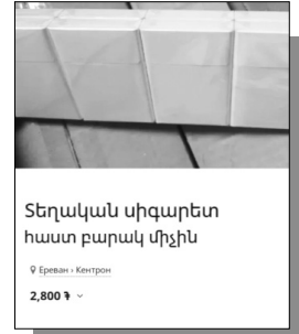
Տեղական սիգարետ հաստ բարակ միջին 9 Երեսն - Կեղտոն 2,800 Դ

Հայաստանում անհայտ ծագման ծխախոտի անօրինական վաճառքը նոր թափ է ստանում: Էլի անանուն, առանց ակցիզի ծխախոտներ են վաճառվում արդեն օնլայն տիրույթում: «Ժողովուրդ» օրաթերթը դեռ նախորդ տարի էր գրել, որ հատկապես գյուղական վայրերում լայն տարածում է ստացել անհայտ ծագման ծխախոտների վաճառքը: Մեկ տարի անց էլ, սակայն, իրավիճակը, փաստորեն, չի շտկվել: Այսպիսով՝ «Ժողովուրդ» օրաթերթը նկատել է, որ վաճառքի ամենատարածված կայքերից մեկում՝ List.am-ում, անհայտ ծագման ծխախոտի վաճառքը շարունակվում է: List.am-ում տարածված լուսանկարից երևում է, որ անհայտ ծագման ծխախոտը, որը, ի դեպ, տեղական արտադրման է, վաճառվում է մեկ բլոկը 2800 դրամով: Ներկայացված լուսանկարներում երևում է նաև, որ ծխախոտի տուփի վրա չկա որևէ մակնշում: Այսինքն՝ գնորդը չգիտի, թե ինչ է գնում, ինչ որակի, ում կողմից է արտադրված և այլն. միայն պարզ է, որ էժան է, ու ծխախոտի տուփ, և ոչ ավելին: