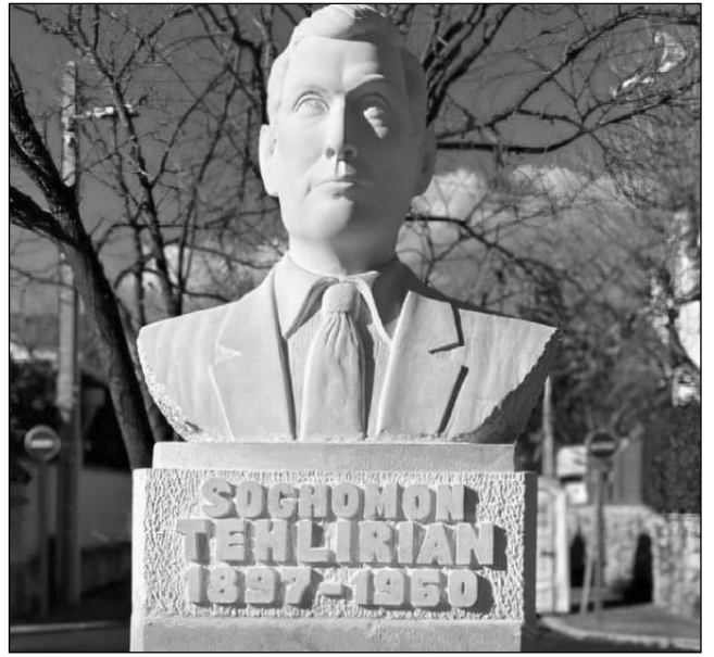
Մարտելում մարտի 15-ին կբացվի Սողոմոն Թեհլերյանի հուշարձանը: