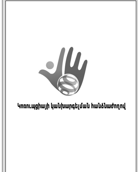
Կոռուպցիայի կանխարգելման հանձնաժողով

Կոռուպցիայի կանխարգելման հանձնաժողովի ապրիլի 1-ին հրապարակած հաշվետվության համաձայն 17 հազարից ավելի անձ ներկայացրել է հայտարարագիր: