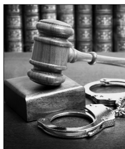
Շարունակությունը՝ ArmLur.am կայքում:

Շուրջ 2 տարի անց ԲԳ պատգամավոր Հայկ Սարգսյանի ընտանիքին պատկանող խանութի տարածքում պայթյուն իրականացրած ենթադրյալ հանցագործին բացահայտել են, բայց գտնվելու վայրը չգիտեն ու հետախուզում են հայտարարել: «Ժողովուրդ» օրաթերթին հայտնի է, թե ով է հետախուզվողը, նա Երեւան քաղաքի բնակիչ Գարեգին Վ.Ն է: «Ժողովուրդ» օրաթերթի տեղեկություններով՝ նրա անունը տվել են ԲԳ գրասենյակի, ԲԳ պատգամավոր Գագիկ Մելքոնյանի տանը պայթուցիկների գործով կալանավորվածները: «Ժողովուրդ» օրաթերթի հետ զրույցում ԲԳ պատգամավոր Հայկ Սարգսյանի հայրը՝ Զարեհ Սարգսյանը, հայտնեց, որ իրեն կամ որդիներին չեն իրավիճակ հարցաքննության: Ըստ նրա՝ հետախուզվողին չեն ճանաչում, անգամ անվան ու ազգանվան առաջին տառն էլ իրենց ոչինչ չի ասում: Նշենք, որ քննչական կոմիտեն հայտնել էր, որ քննության ընթացքում ձեռք բերված փաստական տվյալներով պարզվել է, որ Երեւան քաղաքի Նոյ թաղամասի 143/1 տան բակում պայթյունի իրականացմանը, ինչպես նաեւ Երեւան քաղաքի Գ. Գյուլբենկյան փողոցի 33-րդ շենքի եւ Գյուլբենկյան 30/3 հասցեում գտնվող «Քաղաքացիական պայմանագիր» կուսակցության գրասենյակի մոտ պայթուցիկ սարքերի տեղադրման կազմակերպմանը, բացի վարույթով մեղադրյալ Գ. Ս.՝-ից եւ ինքնությունները դեռեւս չբացահայտված անձանցից, մասնակցել է նաեւ 42-ամյա Գ. Վ.Ն: