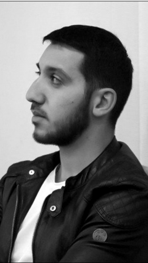
փորձում էր ինչ-որ բան անել իջնելիս: Ես միայն վերբալ արտահայտություններ եմ հնչեցրել, բայց նրան չեմ հարվածել»,-ասաց ֆաղաբաբուն:

Նա իշխանական պատգամավոր է, ես ֆաղաբաբու եմ, որն ունի ֆաղաբաբուական դիրքորոշում սալու իրավունք իր երկրում սեղի ունեցող իրադարձություններին, ինչպես նաեւ իշխանությունների ֆայլերի, խոսքերի վերաբերյալ: Ես ընդամենը սասել եմ այն, ինչ մտածել եմ, իմիջիայրոց, նա այնպես հարվածեց ինձ, որ հենախոսու ու դրամապանակս սարբեր կողմեր շարժվեցին, ինքը ոտներով էլ