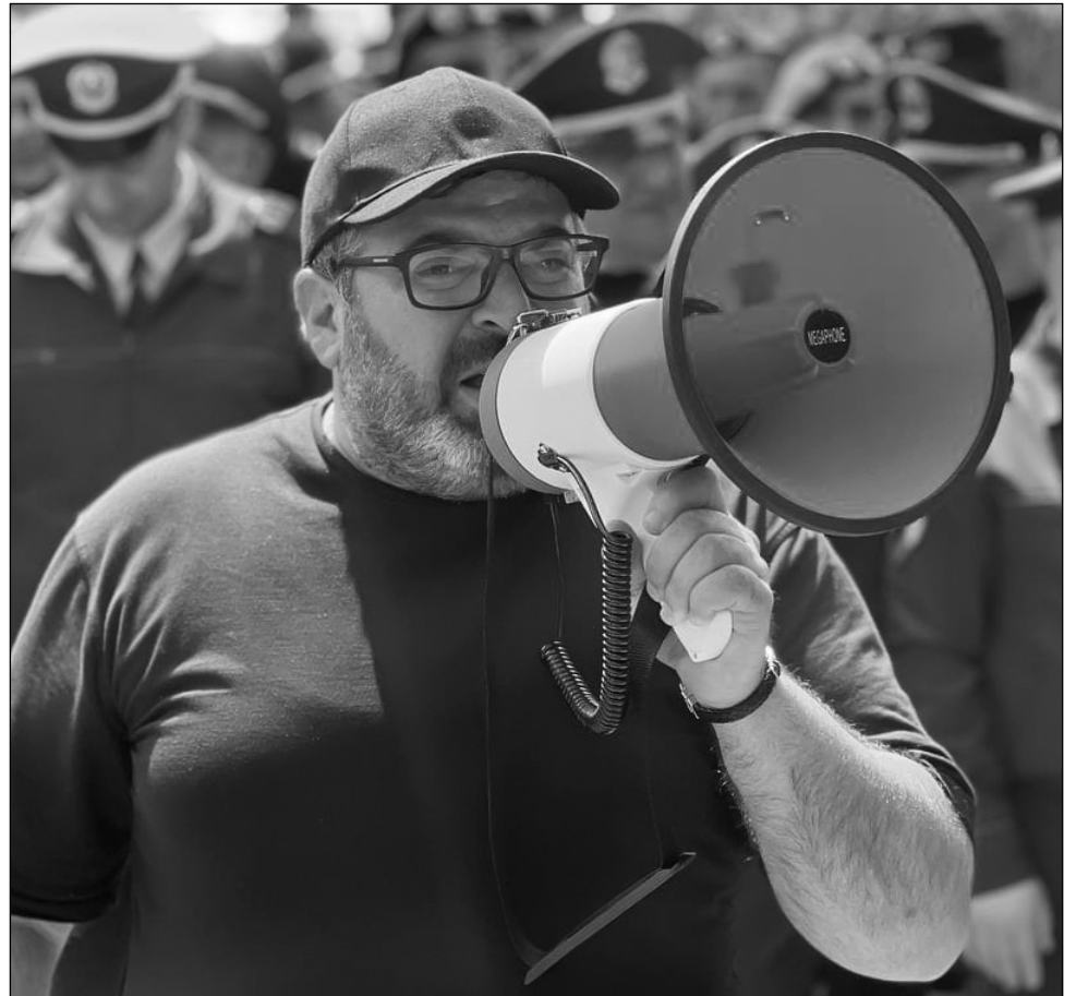
Կիրանցեցիները կրկին ճանապարհը փակել էին:

Ամբողջ աշխարհը ողբ է հասկանա՝ Հայաստանում ինչ բարեք են սիրում: