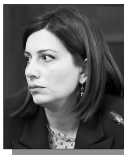
Շարունակությունը՝ ArmLur.am կայքում:

Որ առողջապահության նախարար Անահիտ Ավանեսյանը ծախսող է իրեն վերապահված ուրոտը, բազմիցս ենք անդրադարձել. ու որքան երկար է նա աշխատում այդ պաշտոնում, այնքան ավելի է ձգվում ծախսողումների շարքը: Հերթական ծախսողումը կապված է առողջության պարտադիր ապահովագրության համակարգի ներդրման հետ: Այս տարվա հունվարին նախարարը հայտարարեց, թե 2024 թ. հուլիսից կմեկնարկի բժշկական պարտադիր ապահովագրության համակարգը: Նշեց, որ այն կիրառործվի փուլերով. սկզբում պետպատվերի շահառուները կներառվեն համակարգում: «Նրանք մինչեւ 18 տարեկան երեխաներն են, առաջին, երկրորդ եւ երրորդ կարգի հաշմանդամություն ունեցող անձինք են կամ ֆունկցիոնալության այդ աստիճաններն ունեցող քաղաքացիները, եւ ունենք մի շարք այլ խմբեր», - մանրամասնել էր նա: Բայց, պարզվում է՝ մինչեւ հիմա ընդունված չէ այս ուրոտը կարգավորող օրենսդրական փաթեթը. այն անգամ կառավարության հաստատմանը չի ներկայացվել: Իսկ երեկ էլ Ավանեսյանը, լրագրողների հետ ճեպագրույցում, հարցին, թե առաջին փուլի մեկնարկը երբ է նախատեսված, ասել է. «Քանի որ սա օրենսդրական մեծ փաթեթ է, շատ դժվար է դրա ընդունման ժամկետները հստակ սահմանել, որովհետեւ դեռ ԱԺ-ում պետք է քննարկումներ տեղի ունենան, եւ նախագծի շուրջ ԱԺ-ում էլ թե՛ հանրային լուսման պետք է լինեն, թե՛ նաեւ պատգամավորների կողմից որոշակի առաջարկներ»: Այսինքն՝ ակնհայտ է, որ այդ համակարգն այս տարվա հուլիսից չի մեկնարկի, ինչպես խոստացել էր նախարարը: