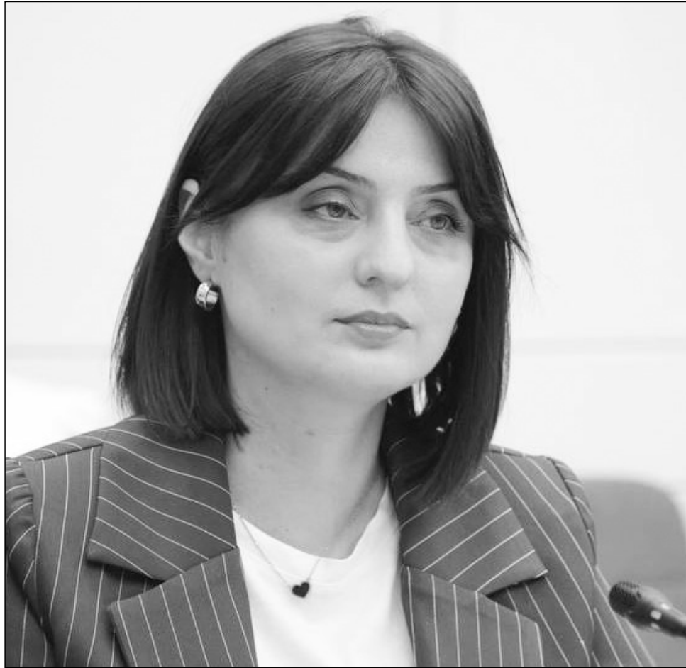
Ինչու՞ մինչեւ հիմա նման նախաձեռնությամբ հանդես չէր գալիս իշխանությունը:

-Ես չեմ կարծում, որ օրենքի կիրարկումը ճնշում է քաղաքացու կամ կազմակերպության վրա, որովհետեւ օրենքին ենթարկվելը եւ օրենքով սահմանված կարգով գործելը, կարծում եմ, նորմալ է, եւ այդպես էլ պիտի լինի. դրա կիրարկումը ճնշում չեմ կարող համարել: Այնպես որ, ես այդ դիտարկման հետ համաձայն չեմ: