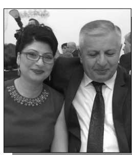
Հարունակությունը՝ ArmLur.am կայքում: