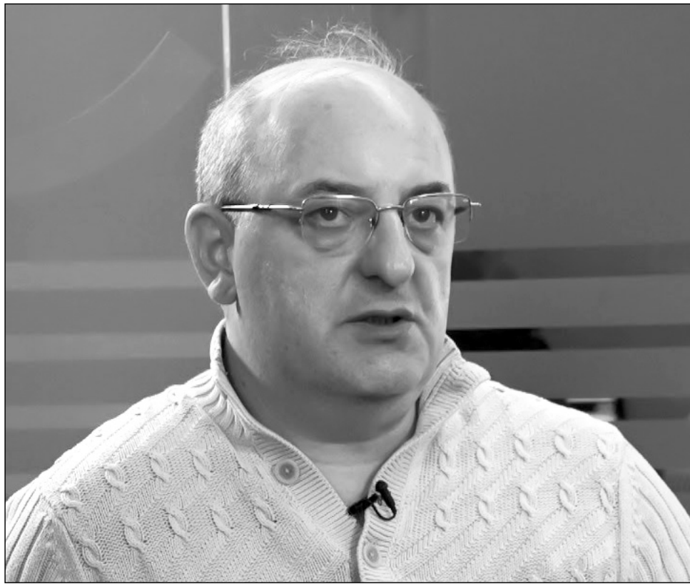
Խանութայինների կողմից՝ մեր հասարակության համար:

-Այսինքն, Ձեր դիտարկմամբ, սա հերթական «Փի Ար» գործողությունն է ի՞նչ: