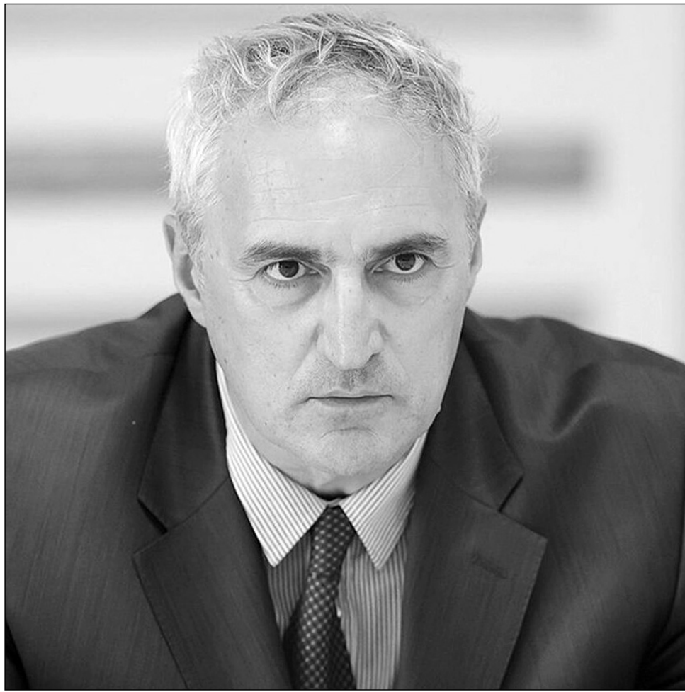
Ինքն արդեն գիտի ժողովրդի կարծիքը, ինչ է փոխվելու հիմա:

-Նիկոլ Փաշինյանը արդեն մեկ անգամ մերժել է հանրաքվեի Ձեր առաջարկը՝ ասելով, թե դրա կարիքը չկա, քանի որ